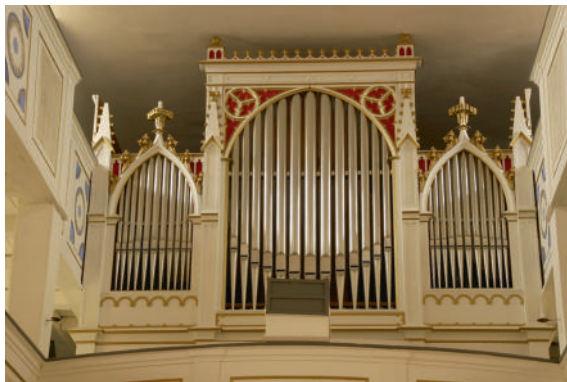
Orgel in der Kirche Maua

----- GH = Gemeindehaus; GR = Gemeinderaum; GZ = Gemeindezentrum; LKG = Landeskirchliche Gemeinschaft; MNH = Martin-Niemöller-Haus; GPIn = Gemeindepädagogin; Lekt./ Lektn. = Lektor/ -in; Pfrn. = PfarrerIn; Pn. = PastorIn; Präd./ Präd. = Prädikant/ -in