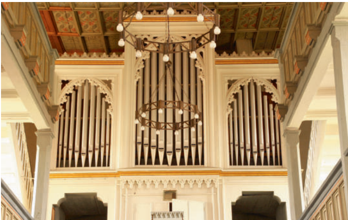
Orgel in der Kirche Rothenstein

Einige Termine im Juli standen bei Redaktionsschluss noch nicht fest.